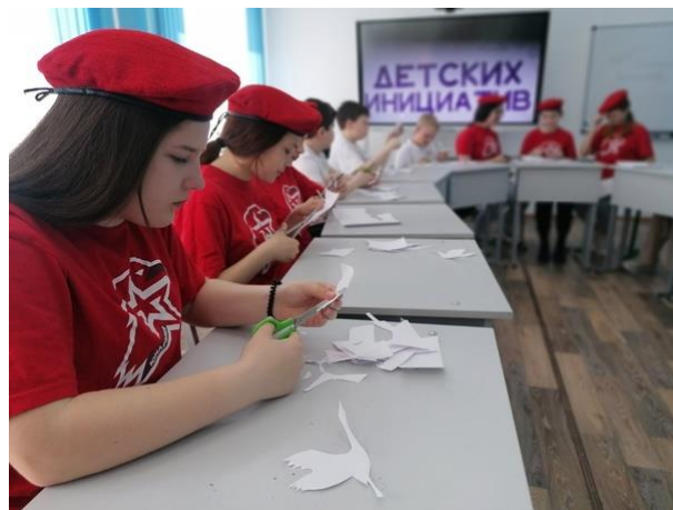
39. Традиционная акция «Окна Победы».

40. Отряд "Юнармеец имени Героя РФ Ягидарова Дениса Сергеевича" принял участие в старте молодежного веломарафона «Наследники Победы», посвященного 78-й годовщине Победы в Великой Отечественной войне.