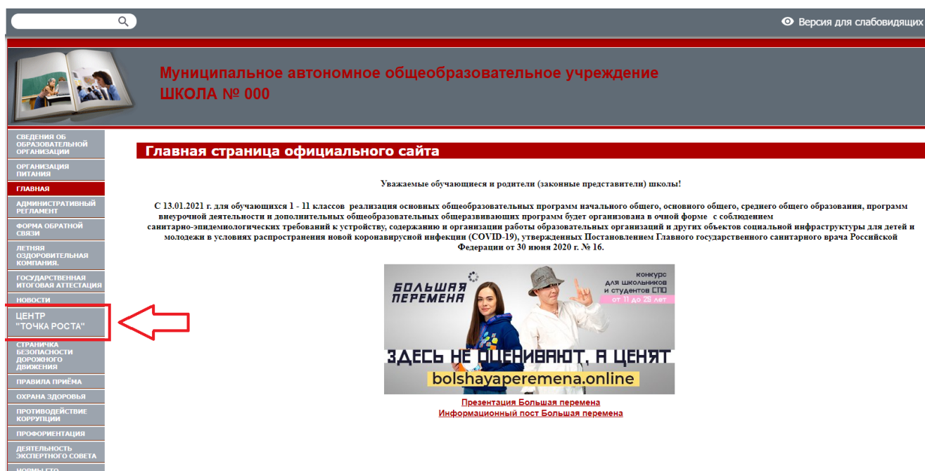
Рисунок 2. Пример размещения ссылки на раздел на сайте общеобразовательной организации

На официальном сайте общеобразовательной организации, в которой создается центр образования естественно-научной и технологической направленностей «Точка роста» (далее – центр «Точка роста», центр) в рамках федерального проекта «Современная школа» национального проекта «Образование», не позднее даты начала функционирования центра (не позднее 1 сентября года создания центра) создается раздел «Центр «Точка роста»». Ссылка на раздел размещается в главном меню сайта общеобразовательной организации и должна быть видима при просмотре каждой страницы. Ссылка не может являться вложенной в другие меню. Пример размещения ссылки на раздел «Центр «Точка роста» в меню официального сайта общеобразовательной организаций в информационно-телекоммуникационной сети «Интернет» приведен на рисунке 2.